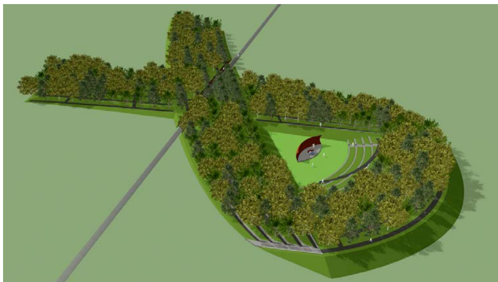
Impressie Nationaal Monument MH17

De aanplant van de bomen door de nabestaanden is voorzien voor maart 2017. De onthulling van het monument en gedenkteken is op 17-7-17: drie jaar na de ramp.